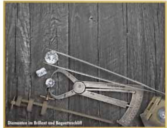
Diamanten im Brillant und Baguette-Schliff

ten vorzulegen. Laut Experten kann beispielsweise eine Rolex GMT Master aus den 70er Jahren bis zu 9.000 EUR erzielen. Des weiteren bieten die Experten von „Bares für Wa(h)res" kostenlose Wertschätzung von Diamanten an. Besonders interessant sind Diamanten im Brillant-Schliff ab einer Größe von 0,50 Carat. Hier gilt immer die Faustregel: ein einzelner großer Diamant ist wertvoller als viele kleine Diamanten. Ein Besuch bei den Experten lohnt sich in jedem Fall, denn hier wird Ihr Schatz professionell taxiert und zu einem fairen Preis entgegen genommen.