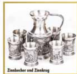
Zinnbecher und Zinnkrug