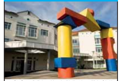
Foto: Zentrum für Kinder- und Jugendmedizin, Haupteingang / Markus Schmidt